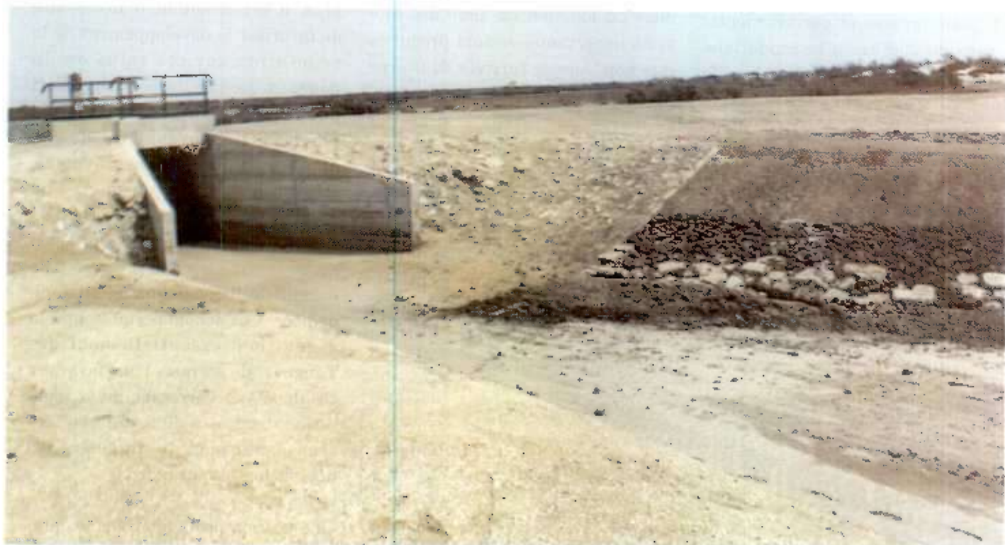
Photo n°4 : Réparation de cristaux similaires surcraux à l'aval de l'ouvrage de Lekser en 1994. Ces réparations (juin 1964) ont bien résisté aux débites beaucoup plus importantes de l'inondation 1997.