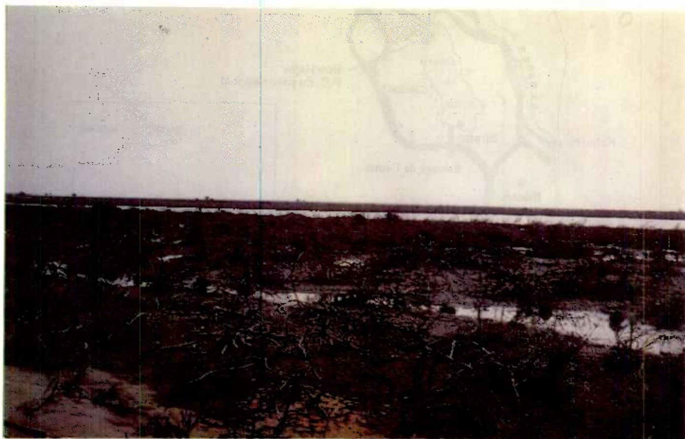
Photo n°2 : Ancienne mangrove du continent Iles-Vielles avec par les eaux hypersalines à l'aval de Diama (teneur supérieure à 80 g/l) - 1994.