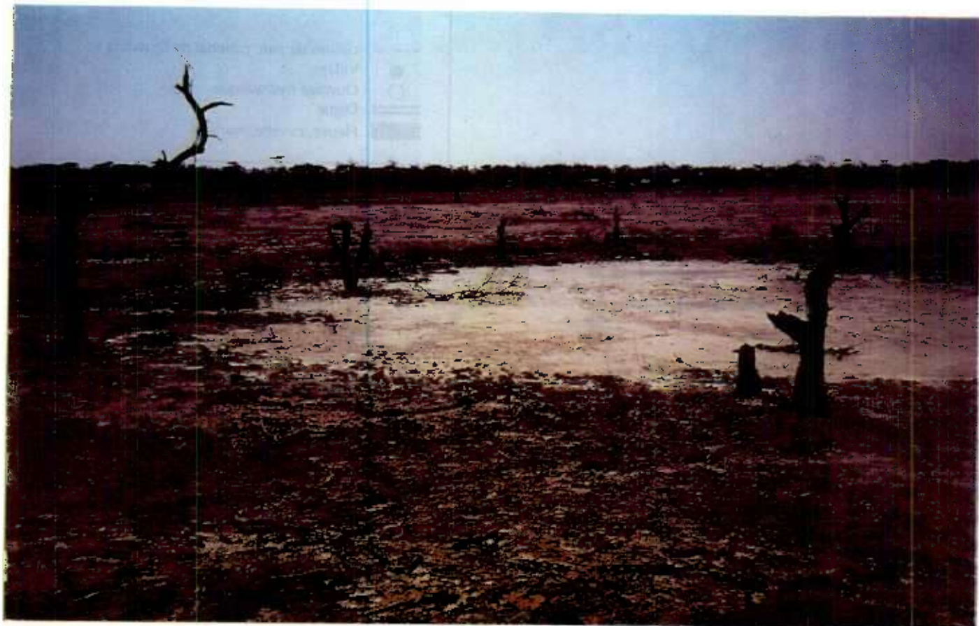
Photo n°1 : Cavette de la dune de Birette à proximité de la retenue de Diama. En 1993, il y avait encore une forêt productive de gommiers (acacia nilotica), actuellement, on y récolte le sel.